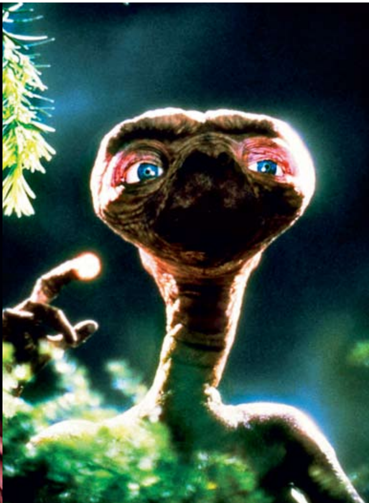
E.T.: The Extra-Terrestrial , regi Steven Spielberg, 1982.

det hos vardagstingen – bilar, tv-apparater, mobiler och porslin. Det är svårt att hitta riktigt fula tv-apparater eller groteska bilar på marknaden.