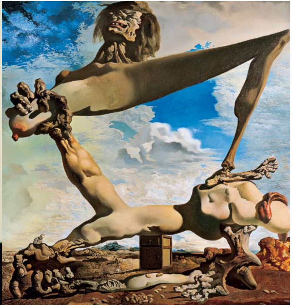
Till höger: en punkare, 1998. Till vänster: Salvador Dalí, Mjuk konstruktion med kokta bönor . Förebud till inbördeskriget , 1936. Bilder (där inte annat anges) ur Om fulhet av Umberto Eco (Brombergs).