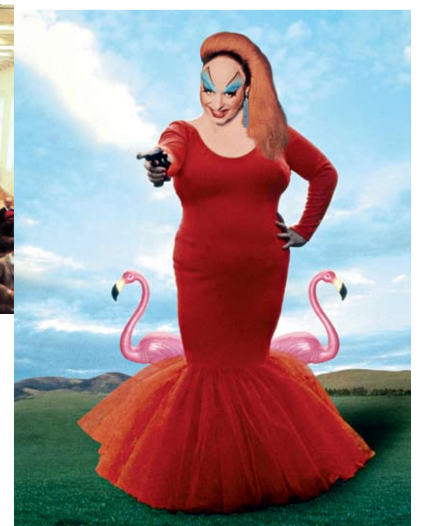
Ovan till vänster: Niki de Saint Phalle, Hon , 1966. Till höger: Divine i Pink Flamingos , regi: John Waters, 1972.

FUL MOTBJUDANDE, FRÅNSTÖTANDE, HEMSK, RYSLIG, FRUKTANSVÄRD, VEDERVÄRDIG, FASANSFULL, FÖRFÄRLIG, ÄCKLIG, VIDRIG, AVSKYVÄRD, VÄMJELIG, GROTESK, OANSTÄNDIG, SMUTSIG, OBSCEN, DEFORMERAD, VIDRIG, LÄSKIG, RUGGIG, TRIST, BEIGE