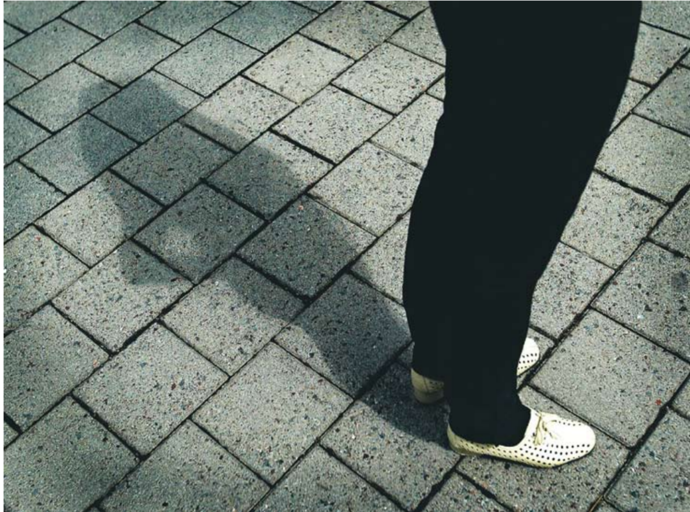
Den skyddade lever ofta ett mycket isolerat liv. Barn till hotade föräldrar bär på ett stort ansvar, när de inte får berätta om sin riktiga identitet.

– Det är förskräckligt att den skyddades liv hela tiden ska inskränkas och