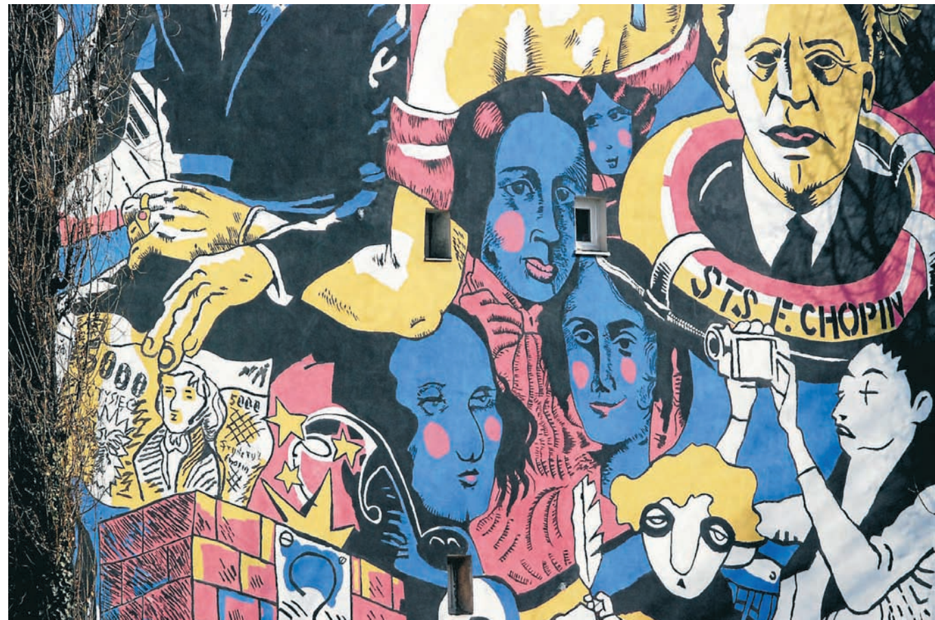
Snygg graffiti är ingen ovanlig syn på husväggar i Warszawa.

var året då Sigismund, som senare blev kung över både Sverige och Polen, föddes. Hans föräldrar var Katarina Jagellonica, syster till den polske kungen, och den svenska kungen Erik XIV:s bror Johan. Sigismund tvingades bort från tronen av sin farbror.