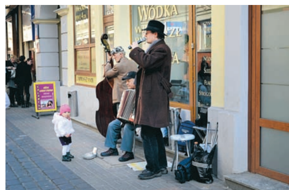
Gatumusikanter sprider förundran.

Judegett i Warszawa var Europas största och hade 400 000 invånare innan kriget började. Under bara ett par månader 1942 skickades över