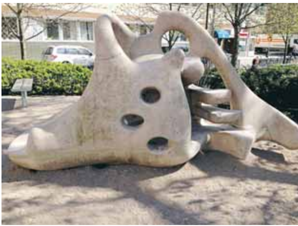
Tufsen i Droskanparken i Stockholm.